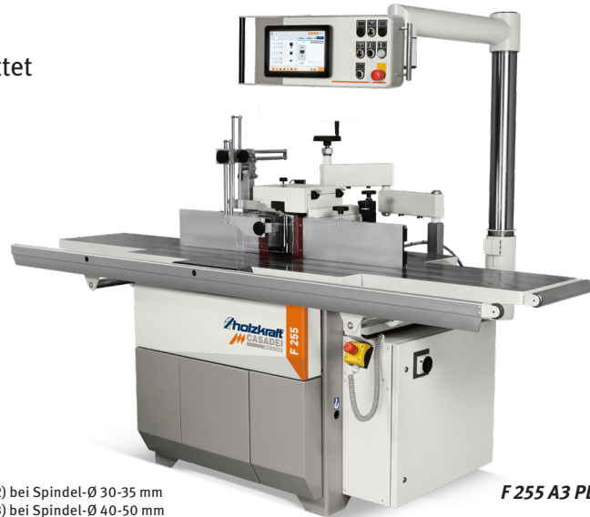
F 255 A3 PL Aktion

Tischfräsen für höchste Ansprüche. Ausgestattet mit Elektrospindel-Direktantrieb